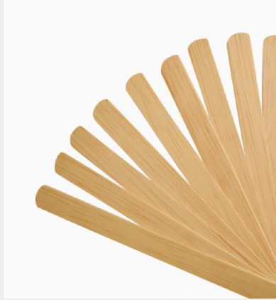
2. Stik es krim