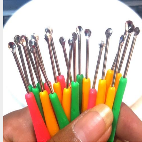
3. Korek kuping stainless (kalau punya)