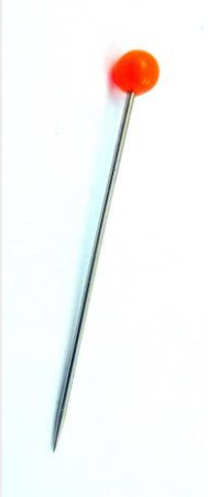
1. Jarum pentul